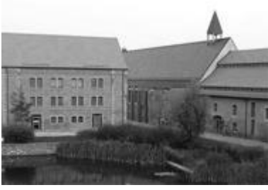
Kloster Helfta, Reinhard Weis

Am Samstag, dem 14.06.2025 wird für uns ein komfortabler großer Reisebus mit 48 Plätzen von Stendal nach Helfta fahren. Alle Frauen unserer Gemeinden sind eingeladen, die Gelegenheit zur gemeinsamen Reise nach Helfta zu nutzen. Der Fahrpreis für die Hin- und Rückfahrt beträgt 35,00 €/Person.